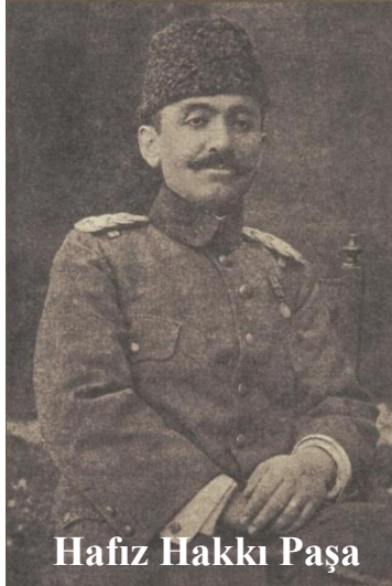
Hafız Hakkı Paşa