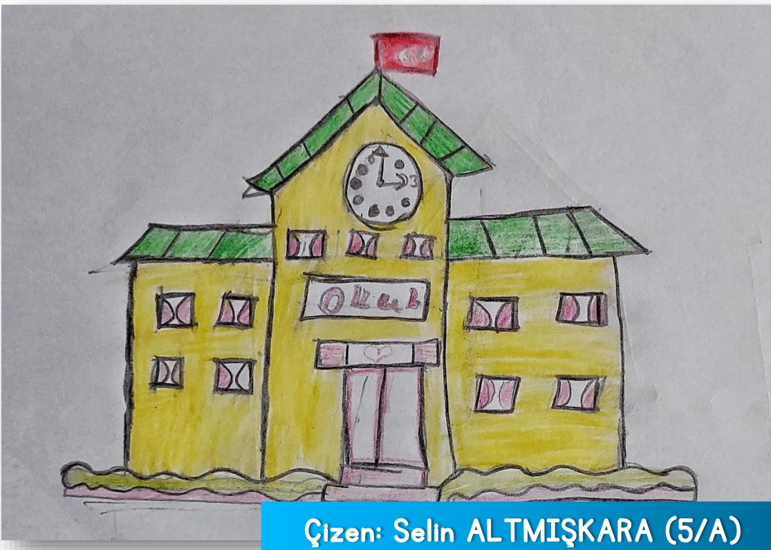
Çizen: Selin ALTIŞKARA (5/A)