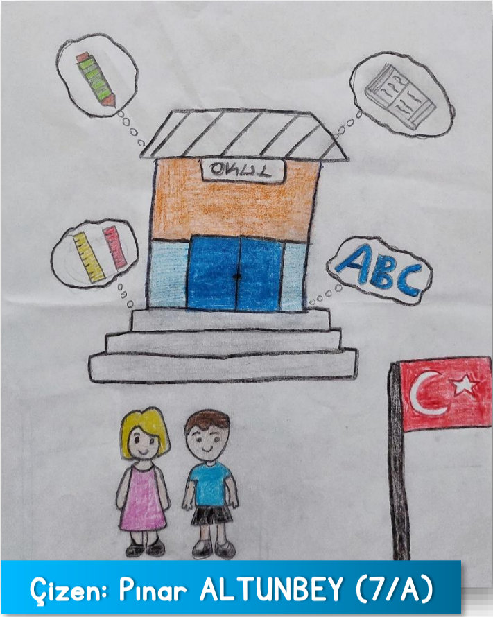
Çizen: Pinar ALTUNBEY (7/A)