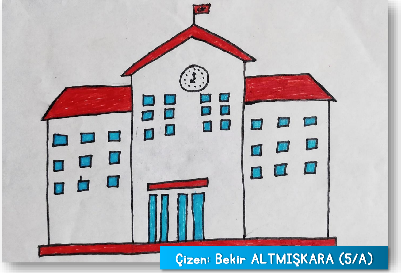
Çizen: Bekir ALTIŞKARA (5/A)